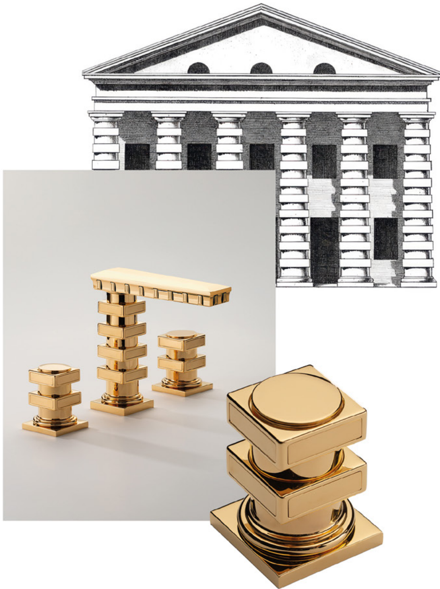
Mélangeur de lavabo 3 trous Saline Royale avec décors, présenté en Doré Brillant. Saline Royale 3-hole basin mixer with decoration, shown in Polished Gold.