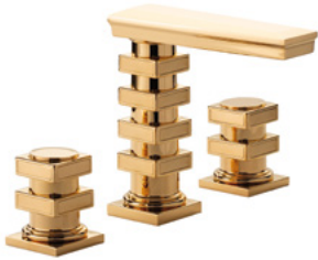
Ref. S241-D1-1301 Mélangeur de lavabo 3 trous sans décors, Doré Brillant. 3-hole basin mixer without decoration, Polished Gold.

The handles and spout reinterpret the motif of the "Ledolcian" column — a characteristic assembly of stacked blocks and cylinders — as it appears on the façade of the Saline Royale d'Arc-et-Senans. The geometric rigour of this architectural vocabulary, with its remarkable clarity, lends the collection a presence that is at once classical and resolutely contemporary.