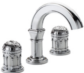
Ref. S240-A1-1302 Mélangeur de lavabo 3 trous bec bas, Chrome Brillant. 3-hole basin mixer low spout, Polished Chrome.