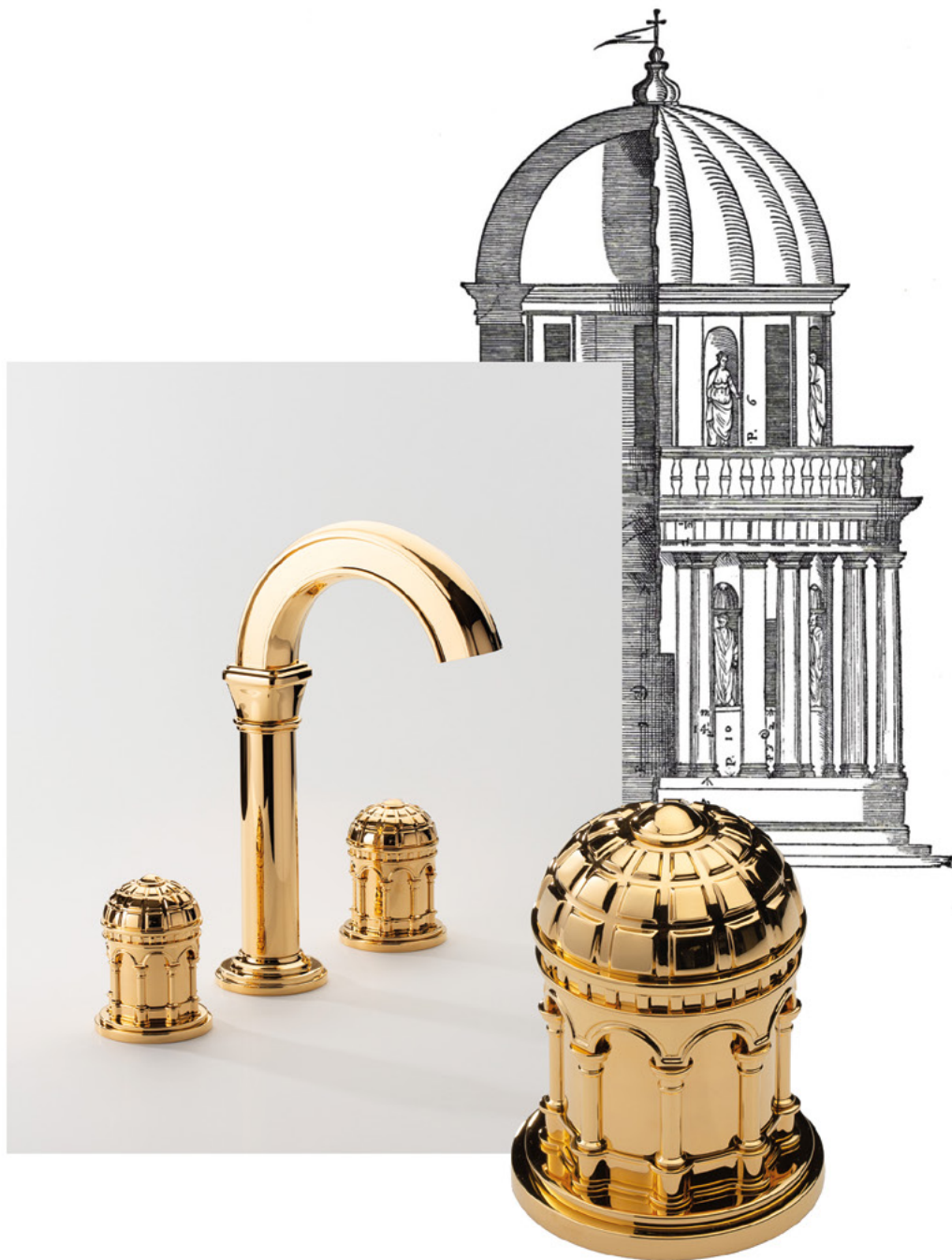
Mélangeur de lavabo 3 trous Bramante bec haut, présenté en Doré Brillant. Bramante 3-hole basin mixer high spout, shown in Polished Gold.