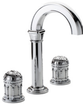
Ref. S240-A1-1301 Mélangeur de lavabo 3 trous bec haut, Chrome Brillant. 3-hole basin mixer high spout, Polished Chrome.