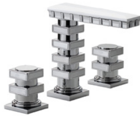
Ref. S241-A1-1302 Mélangeur de lavabo 3 trous avec décors, Chrome Brillant. 3-hole basin mixer with decoration, Polished Chrome.