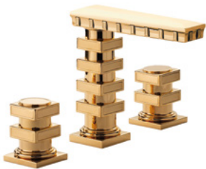
Ref. S241-D1-1302 Mélangeur de lavabo 3 trous avec décors, Doré Brillant. 3-hole basin mixer with decoration, Polished Gold.