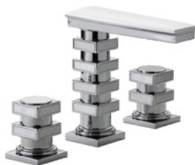
Ref. S241-A1-1301 Mélangeur de lavabo 3 trous sans décors, Chrome Brillant. 3-hole basin mixer without decoration, Polished Chrome.