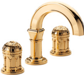
Ref. S240-D1-1302 Mélangeur de lavabo 3 trous bec bas, Doré Brillant. 3-hole basin mixer low spout, Polished Gold.