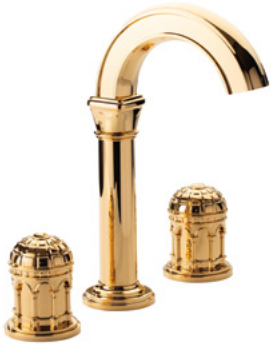
Ref. S240-D1-1301 Mélangeur de lavabo 3 trous bec haut, Doré Brillant. 3-hole basin mixer high spout, Polished Gold.

Each piece bears witness to the precision of the machining and the quality of the polishing — the hallmark skills of the house.