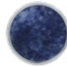
H077 LUXE Blue Sodalite