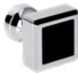
Ref. -9KNS36 Bouton de tirage, 36 x 36 mm Pulling knob, 36x36mm