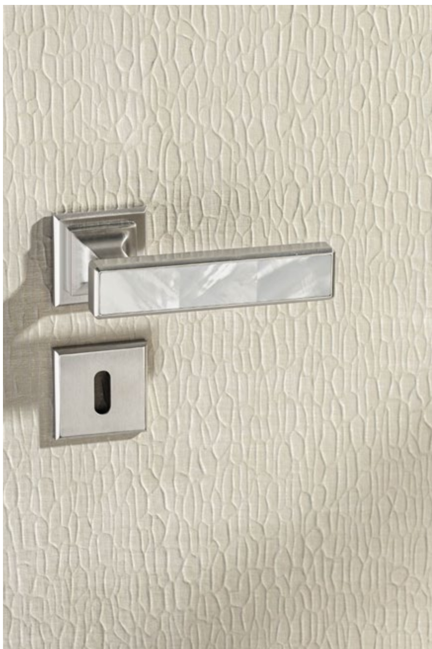
Poignée SQUARE NACRE "White mother of pearl" avec rosaces carrées, présentées en Nickel Mat. SQUARE NACRE "White mother of pearl" door handle with square rosettes, shown in Matt Nickel.

The Square collection is available in a wide range of stone, mother of pearl, wood, leather or coloured inlays.