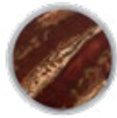
H073 WOOD Sakura