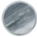
H081 LUXE Grey Bardiglio