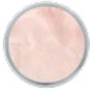
H080 LUXE Pink Onyx