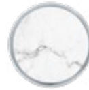
H076 LUXE White Carrara