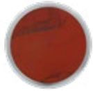
H079 LUXE Red Jasper