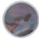
H083 NACRE Dark mother of pearl