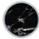
H075 LUXE Black Portoro