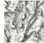
H062 TEXTURE Moon