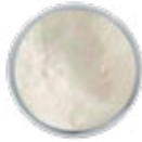
H082 NACRE White mother of pearl