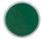
H078 LUXE Green Aventurine