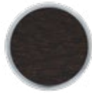
H074 WOOD Wenge