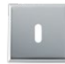
Ref. H000-9DR52 Rosace pour entrée de clés, Carrée 48 x 48 mm Key hole rosette, Square 48x48mm

→ Retrouvez toutes les rosaces et plaques à partir de la p. 82 → See all the rosettes and plates starting on p. 82