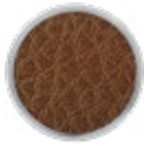
H065 LEATHER Cognac