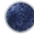
H077 LUXE Blue Sodalite