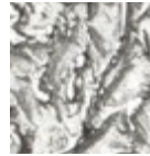
H062 TEXTURE Moon