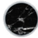
H075 LUXE Black Portoro