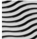
H085 GUILLOCHÉ Wave