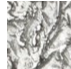
H062 TEXTURE Moon