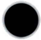
H060 Black inlay